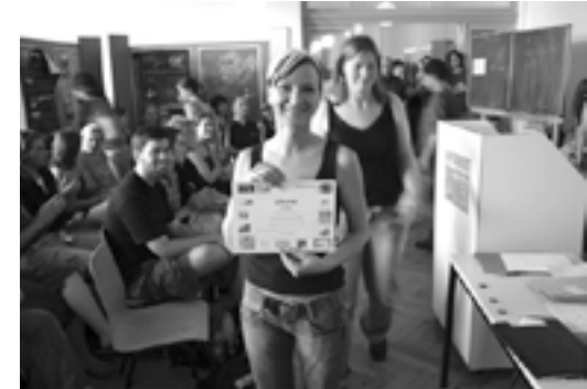
Projektpräsentation des Grundstudiums Juli 2006

Bewährte interdisziplinäre Beiträge aus der Soziologie, Ökonomie und Ökologie wurden in das Bachelorprogramm übernommen, ebenso ein umfangreicher theoretisch-geschichtlicher Komplex, zu dem auch die Denkmalpflege gehört. Der Bachelor wird mit einer wissenschaftlichen Arbeit abgeschlossen, die durch ein vorbereitendes Projekt und ein Tutorium ergänzt wird. So wird im Bachelor-Studium auf die Wissenschaftlichkeit der Ausbildung geachtet, dazu trägt mit eigenen Übungen auch die Planungstheorie bei.